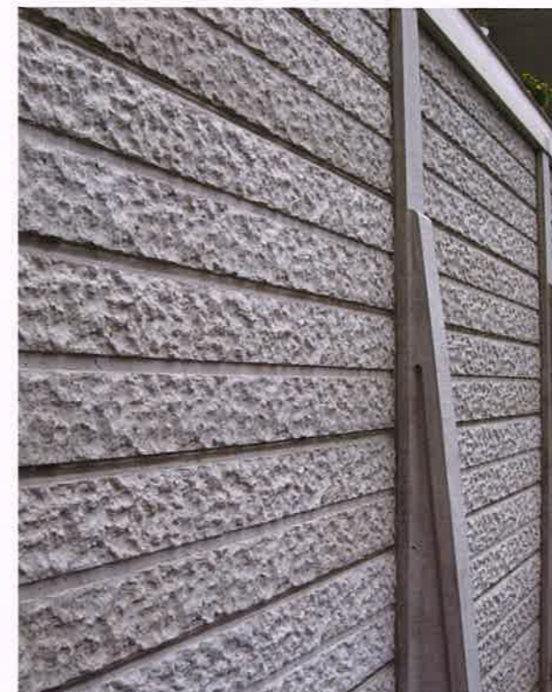
DECO塀 I型 地上高2720mm 施工例

最下段には、フラットで厚みのあるDECO幅木を用いることで、泥はね等の付着防止と簡易土止めを兼ねることができます。