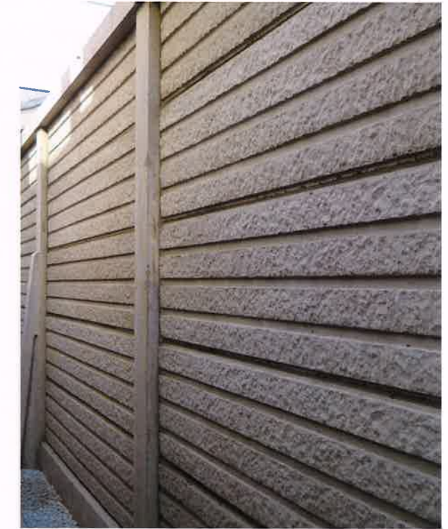
DECO塀 III型 地上高1820mm 施工例