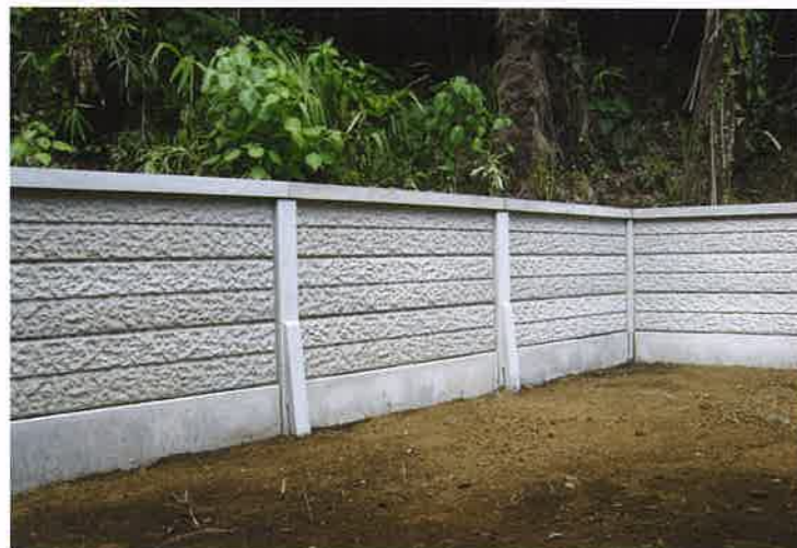
DECO塀 I型 地上高1220mm 施工例