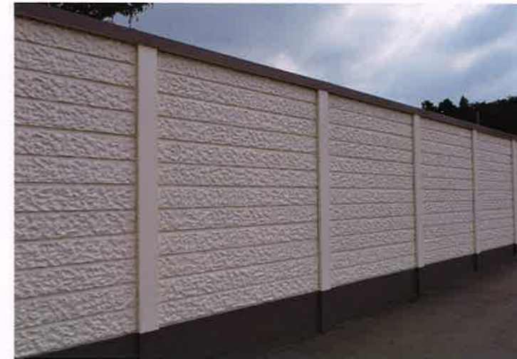
DECO塀 I型 地上高2420mm 塗装 施工例

DECO板には、ハイレリーフ I型とローレリーフ III型の2種類があり、通常は片面にのみレリーフが施されています。