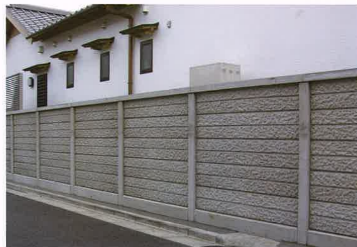
DECO塀 I型 地上高1820mm 施工例